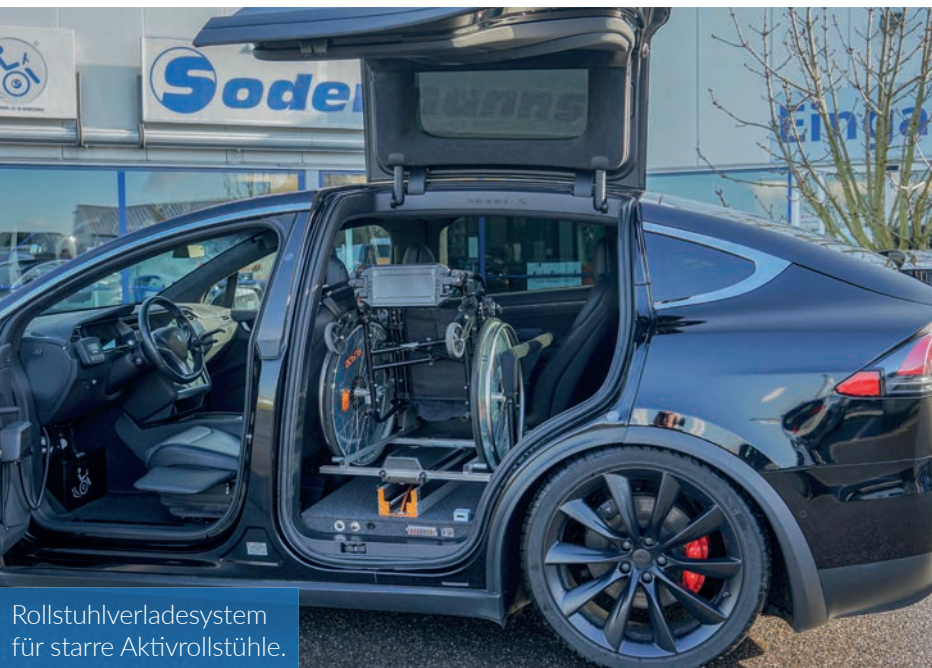
Rollstuhlverladesystem für starre Aktivrollstühle.