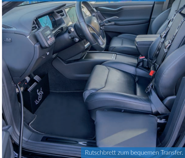
Rutschbrett zum bequemen Transfer.

Der Gas-Bremsschieber ermöglicht das Beschleunigen und Abbremsen des Fahrzeuges mit nur einer Hand. Dazu ist kaum eigene Muskelkraft erforderlich.