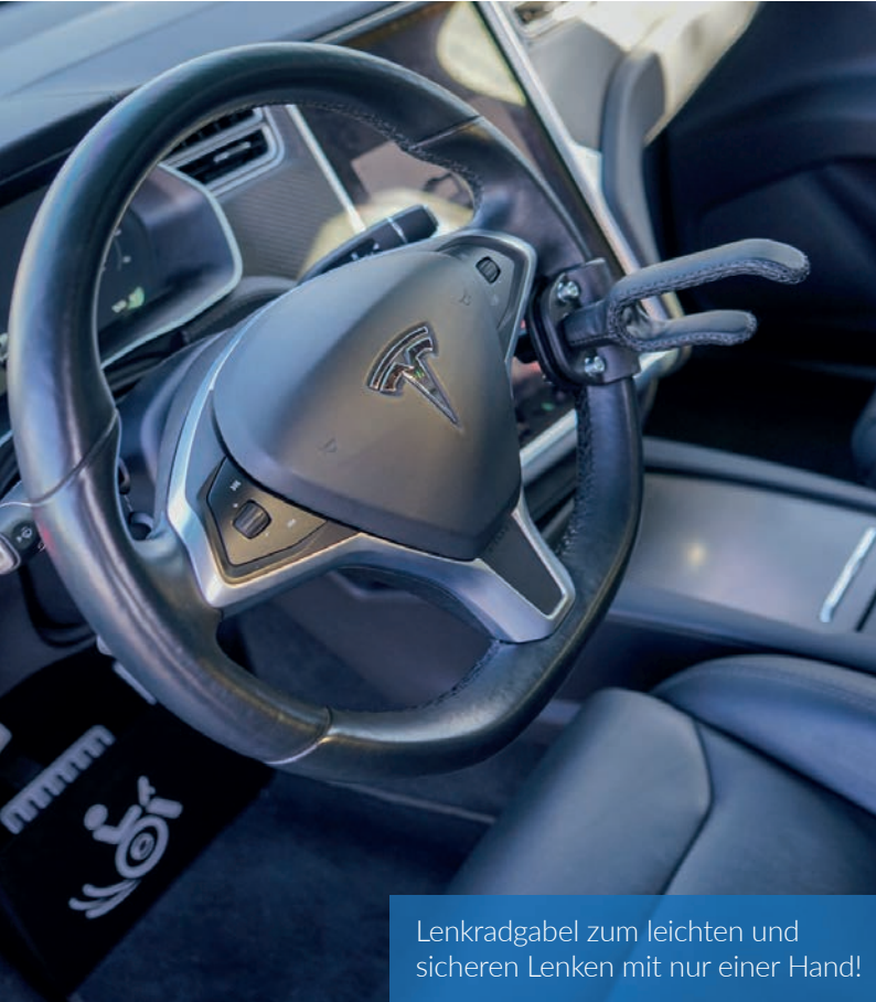
Lenkradgabel zum leichten und sicheren Lenken mit nur einer Hand!

Für Menschen mit Handicap sind sogar nahezu 1.000 PS in Form dieses Tesla Model X sicher und zuverlässig handelbar, dank des hier verbauten Space Drive Systems.